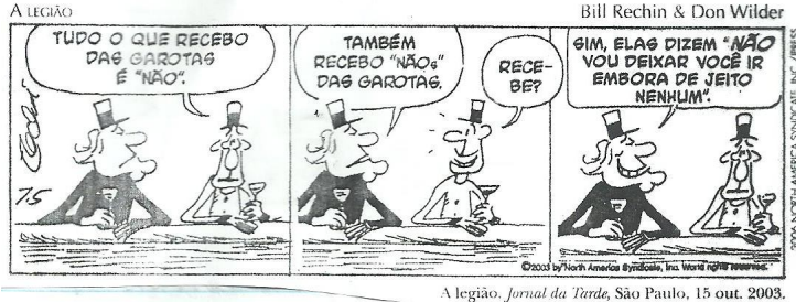
A legião. Jornal da Tarde , São Paulo, 15 out. 2003.

O vocábulo “NÃOs” no segundo quadrinho é um exemplo do seguinte processo de formação das palavras: